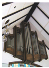
Vieles sieht man nicht We bei fast allen Orgeln ist nur